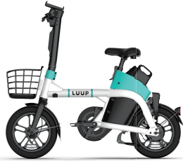
電動アシスト自転車