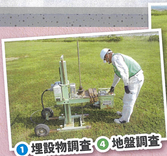
① 埋設物調査 ④ 地盤調査